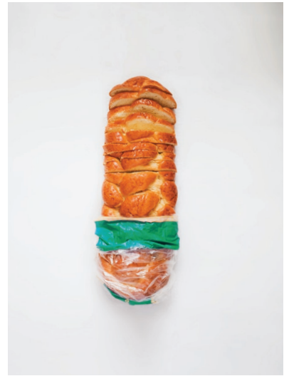
Ruuan valmistaminen itse alusta asti on yksi helpoimmista kiireisestä arjesta karsiutuvia asioita.